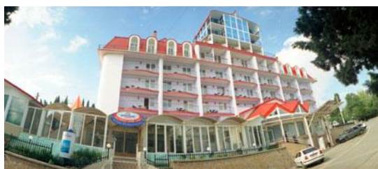
Рис. 1. Пример оформления рисунка

Так виглядит основний текст. Це основний текст. Це основний текст. Це основний текст. Це основний текст. Це основний текст. Це основний текст. Це основний текст. Це основний текст. Це основний текст.